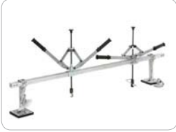
2. Aufsatz für Line-Puller